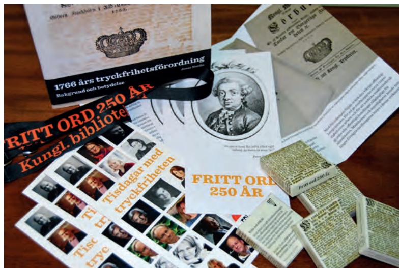
Informationsmaterial och merchandise från Kungliga bibliotekets uppmärksammande av tryckfriheten.

En höjdpunkt i Kungliga bibliotekets program var ”Tisdagar med tryckfriheten” – allitterationen var viktig och man kan säga att namnet föregick innehållet. Avsikten var hur som helst att i en serie öppna samtal få en fördjupad diskussion om olika yttrandefrihetsrelaterade teman. Dessa ägde rum vid fem tillfällen i mars–april 2016. Jag visste att det skulle bli en stor koncentration av aktiviteter under hösten och med programmet förlagt till våren minskade konkurrensen om utrymmet och vi hade också möjlighet att slå an tonen.